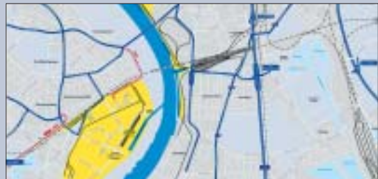
Zwei Zufahrtstraßen zum Logport werden bis 2007 ausgebaut.

Die schriftlichen Anweisungen sind knapp, aber bestimmt.