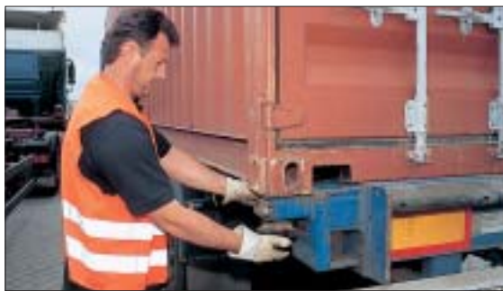
Die Fahrer sollen die Twist Locks schon auf dem Parkplatz lösen.