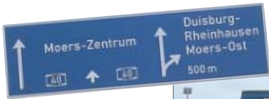
Einer von drei möglichen Wegen führt über die A 40.

Der morbide Charme der denkmalgeschützten „Bliersheimer Villensiedlung“ dokumentiert den Zeitenwandel. Direkt hinter der Einfahrt zum Logport, dem Prestigeprojekt der Duisburger Hafen AG, stehen die alten Gemäuer als stumme Zeugen der industriellen Entwicklung des gesamten Ruhrgebietes. Die alte Montan- und Stahlindustrie wurde abgelöst von einer, sagen wir lieber fast funktionierenden, modernen Dienstleistungs- und Logistikgesellschaft.