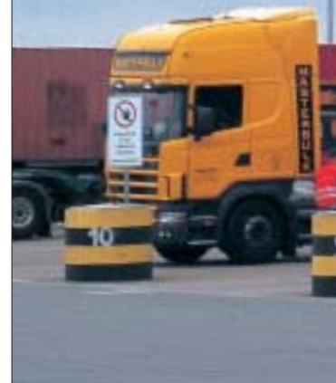
Von Jan Bergrath (Text) und Claudia Rempe (Fotos)

Früher drehte sich hier alles um die Kohle. Vor stummen Zeugen ist der Logport in Duisburg heute eine Prestigesache. Bis zu 1200 Lkw steuern ihn täglich an.