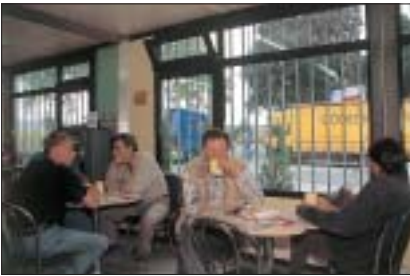
Die Imbissbude Pommes Pierre an der Hamburger Straße hat von sechs bis 15 Uhr geöffnet.