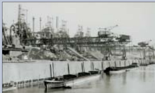
Früher stand das Krupp-Hüttenwerk auf dem Gelände.

Schon am 16. September 1716 eröffnete Duisburg im Rhein-Ruhr-Mündungsgebiet das erste Hafenbecken. Heute ist der Duisburger Hafen der größte öffentliche Binnenhafen Europas. Unter dem Markennamen Duisport schlägt er jährlich rund 42 Millionen Tonnen Fracht um. Die trimodale Logistikdrehscheibe fungiert als Hinterland-Knotenpunkt für die Seehäfen und als Tor für den Güterverkehr nach Zentraleuropa. Mehr als 200 logistikorientierte Unternehmen sind heute im Duisburger Hafen ansässig. Eigentümer ist die Duisburger Hafen AG. Die eigene Duisport-Hafengruppe ist für die Infrastruktur und die Ansiedlung neuer Unternehmen verantwortlich.