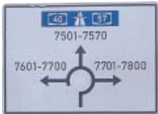
Ein Nummernleitsystem führt zu den 25 Unternehmen.

„Wir haben hier viele selbstfahrende Unternehmer. Die meisten sind zuverlässig, haben gutes Material und kommunizieren prima mit der Disposition.“