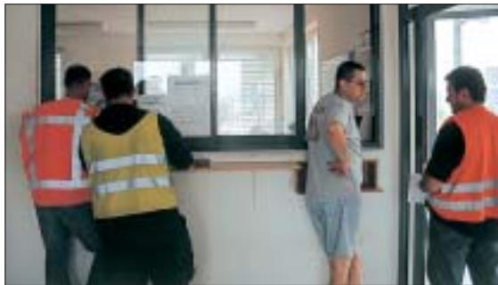
Eigene und fremde Fahrer werden getrennt abgefertigt.